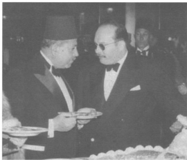
محمود فهمي النوراشي باشا مع الملك